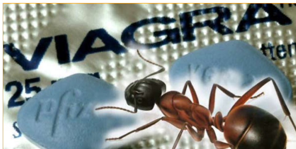
Il citrato di sildenafil, il cui nome commerciale più diffuso è Viagra, è un farmaco utilizzato nella terapia della disfunzione erettile. Inizialmente studiato per la cura dell'angina pectoris, durante i test clinici mostrò scarsa efficacia per l'angina, mentre gli effetti sull'erezione del pene furono evidenti. Il sildenafil fu brevettato nel 1996 e approvato il 27 marzo 1998