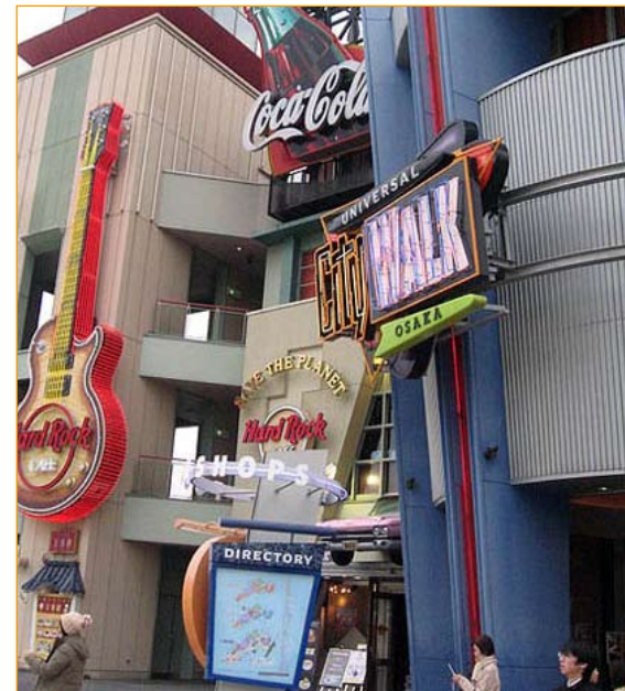
Sette cybercommessi sono stati impiegati in un test pubblico, durato per il momento un solo giorno, e si sono messi al lavoro interagendo con i clienti. È avvenuto a Osaka, in Giappone, in un complesso di negozi per lo shopping e il divertimento