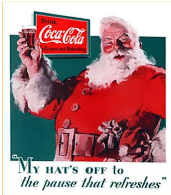
La data della rivista Liberty è del 22 dicembre 1931. Il «Babbo Natale» targato Coca Cola, disegnato da Haddon Sundblom, irrompe sulla scena pubblica statunitense. Haddon divenne un famoso disegnatore di pin up

Il messaggio illustrato che fa a pezzi tutti gli altri. Da regalare, montare, leggere e conservare