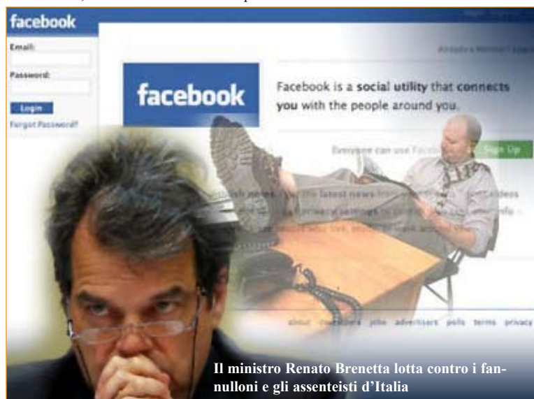
Il ministro Renato Brunetta lotta contro i fannulloni e gli assenteisti d'Italia