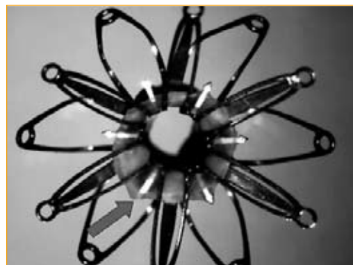
Il «symmetry-connector» è una protesi usata in cardiocirurgia ma subito abbandonata per le gravi controindicazioni che sono state individuate

La quinta sezione penale del tribunale di Roma, presieduta dal giudice Rosanna Ianniello, ha deciso di chiedere con urgenza alla direzione sanitaria dell'ospedale San Camillo quale sia il numero delle valvole cardiache «silzone»