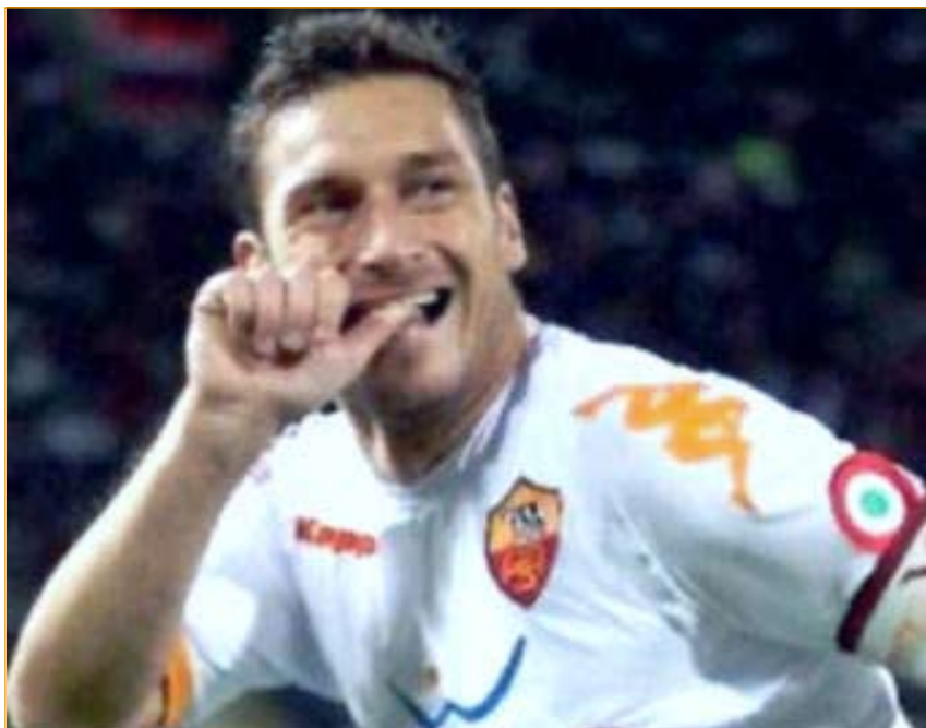
Francesco Totti mentre esulta con il pollice in bocca dopo un gol, dedicandolo alla moglie Ilary Blasi e non ai figli come erroneamente si crede. Un vezzo che ha la bella showgirl è proprio quello di mettersi un dito tra i denti

quando fu definito da France Football «poeta del calcio». Panenka ha rivelato che, per le sue condizioni fisiche (problemi all'anca), fa ormai sport che non lo costringono a correre come il golf e il biliardo e dà solo il calcio d'inizio in partite amichevoli.