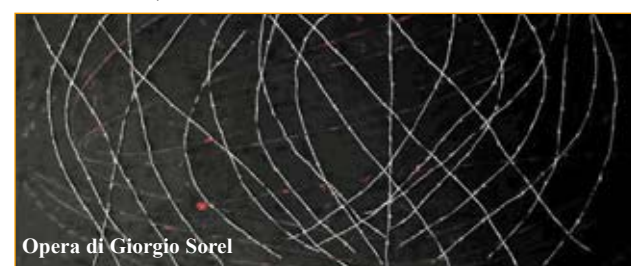
Opera di Giorgio Sorel

laminare, spessorate sulle tele e sulle tavole, si abbina romanticamente alla tradizionale pittura ad olio, che con lucidità contribuisce alla creazione di atmosfere evanescenti, tetre, indefinite... eppure così tremendamente reali. Un'incessante ricerca formale e tecnica, un logorante fervore intimistico e una bruciante passione, fatta di incredibile odio ed incredibile amore per ciò che riguarda l'uomo e gli eventi da lui provocati o passivamente subiti, sfociano in una