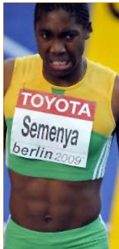
L'atleta sudafricana Caster Semenya, la campionessa mondiale sugli 800 metri, medaglia d'oro a Berlino

Fa ancora discutere il caso di Caster Semenya, la diciottenne mezzofondista americana campionessa del mondo degli 800 metri, sospettata di essere ermafrodita. Una riunione della commissione medica IAAF (Federazione internazionale di atletica leggera) è prevista per il 16 ottobre. Intorno al 20 novembre 2009 si conoscerà il verdetto della stessa IAAF che potrebbe chiudere la carriera della pur giovanissima atleta. Il rapporto medico rappresenta un duro colpo per la Semenya che ha sempre dovuto affrontare commenti maligni sul suo aspetto mascolino.