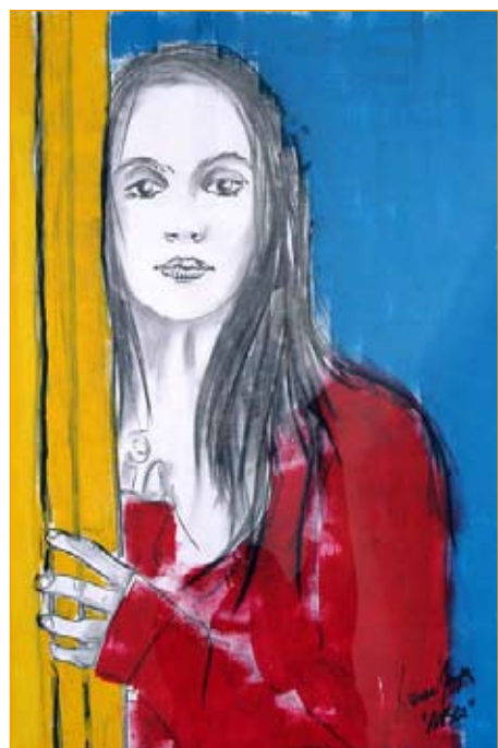
Francesco Renga, Ambra

Dal 25 settembre al 22 novembre 2009. Orario. Da martedì a domenica, dalle ore 11 alle ore 18. Ingresso libero. Informazioni: Associazione Forte di Bard. Tel. + 39 0125 833811. Info@fortedibard.it www.fortedibard.it