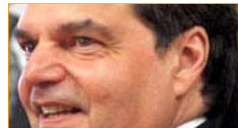
Il ministro Renato Brunetta

È infatti in arrivo un supermanager cui sarà affidata la gestione della complessa macchina organizzativa e burocratica dei tribunali italiani. A margine del workshop Ambrosetti, il ministro ha spiegato che «il governo è al lavoro per introdurre una nuova figura professionale nel mondo della giustizia per risolvere i malfunzionamenti e i ritardi dei tribunali». «In Italia abbiamo la peggiore giustizia d'Europa e il novanta per cento delle inefficienze è di tipo organizzativo» ha aggiunto Angelino Alfano, precisando che il progetto è di competenza del ministro della giustizia.