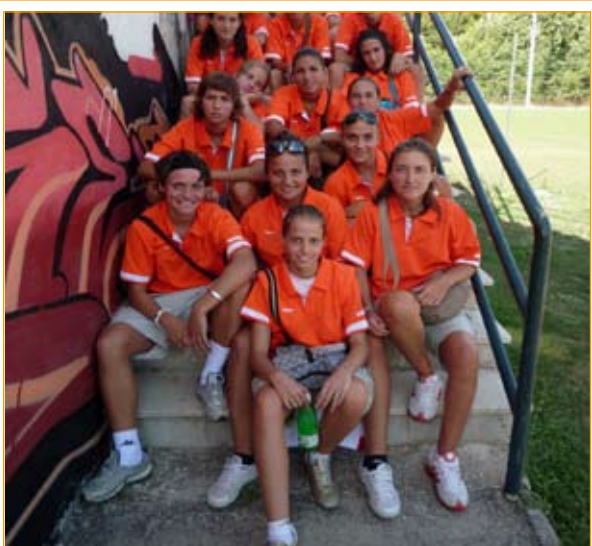
La squadra della Roma calcio femminile durante una pausa nel ritiro precampionato che si è svolto a Licenza

Cambiato il meccanismo di promozione e retrocessione nell'ottica di una ristrutturazione dei campionati che vedrà il suo compimento entro tre anni. La riforma porterà l'organico della serie A da 12 a 14 squadre a partire dalla stagione 2010-2011. Al termine della prossima stagione verranno promosse dalla serie A2 alla serie A le prime due classificate di ciascun girone, ferma restando la retrocessione dalla A alla A2 delle ultime due squadre posizionate in classifica. Solo l'ultima di ciascuno dei due raggruppamenti di A2 retrocederà in B.