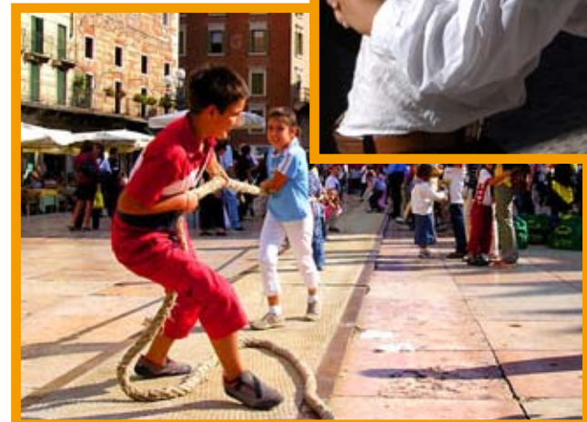
Alcuni momenti dei giochi di strada. In alto, una tipica lotta sarda. La manifestazione veronese di quest'anno è dedicata alla Grecia e ospiterà giocatori provenienti da varie regioni italiane

sciuto dall'Unesco nel 2003 con la Carta internazionale del gioco).