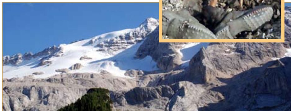
Una veduta della Marmolada. In alto, i resti del milite ignoto