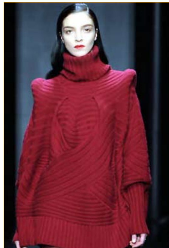
Un modello di Ferragamo